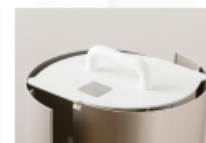
カバー シャンパンゴールド 本体(天板・スタンド部) 白