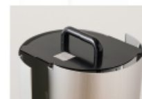
カバー シルバー 本体(天板・スタンド部) 黒