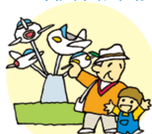
帶著孫子去遊樂園