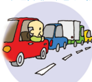
行車時塞車、搭乘巴士旅行